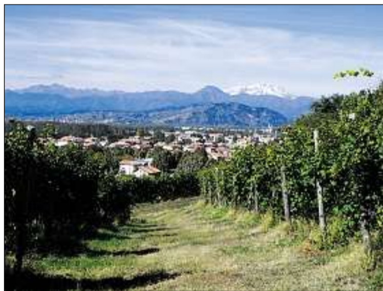
NELLA FOTO: vista su Gattinara e sul Monte Rosa.