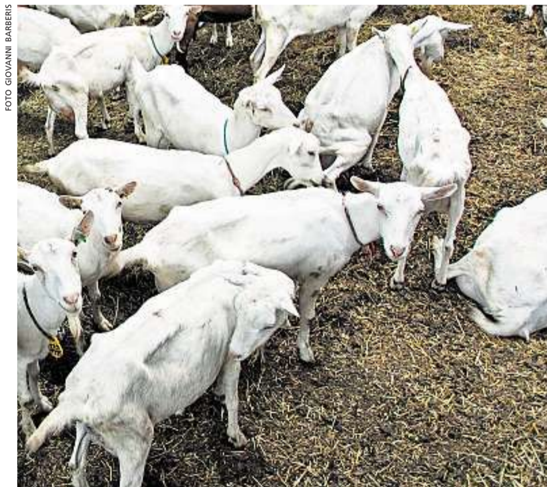
L'ottantina di capre di razza Saanen e camosciate possono uscire a pascolare all'aria aperta quando lo desiderano.