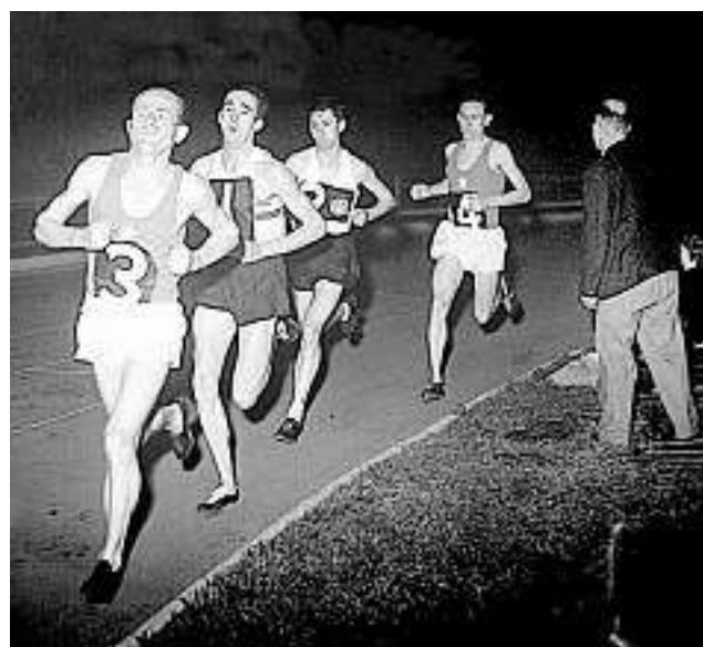
L'atleta Emil Zatopek nel 1955.

Emil esagera. Vince troppo. Alla fine nessuno si stupirà più delle sue vittorie o, peggio ancora, ci si stupirà solo quando non vincerà più. Sembra persino che la stampa sportiva stia già preparando il terreno. Fra qualche anno, preannuncia, Emil sarà solo un ricordo. È la legge dello sport, sospira. L'impressione è che ormai non vedano l'ora di liberarsi di lui». (p. 96). Gli antichi cavarono molte massime da analoghi stati delle cose. «Sic transit gloria mundi». O per approdare al titolo di un «bestseller» medioevale, di Lotario cardinale poi papa Innocenzo III, De miseria humane condicionis . È un latino (medioevale) di non difficile comprensione.