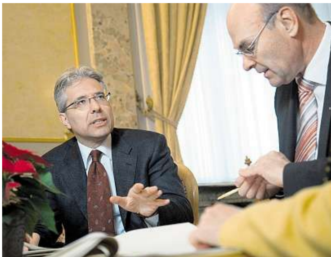
Il consigliere nazionale ticinese del PIR Fabio Abate durante una seduta di lavoro parlamentare a Berna.

Intervista Fabio Abate sul futuro della piazza finanziaria svizzera e ticinese, il caso Ubs e il segreto bancario, al termine dei due anni alla presidenza della Commissione delle finanze del Consiglio nazionale