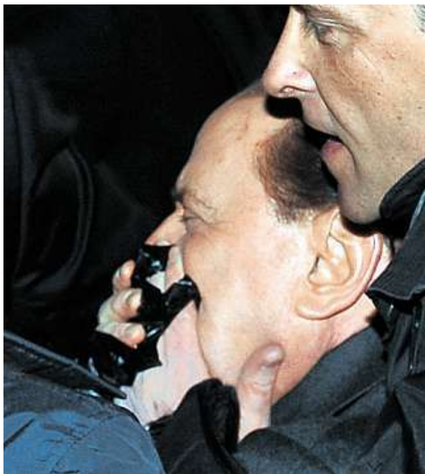
Silvio Berlusconi, pochi attimi dopo l'aggressione.

Sarebbe però semplicistico considerare internet come un canale neutro e privo di specificità, che subisce soltanto una violenza che viene dall'esterno. I social network vengono percepiti dai loro utenti come spazi ibridi, luoghi a metà tra il pubblico e il privato, luoghi dove il tono della conversazione è quello che si tiene tra conoscenti e le opinioni, o meglio le emozioni, vengono espresse senza troppa ponderazione. Il