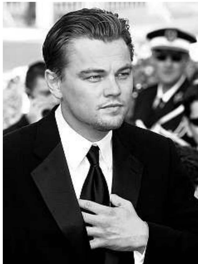
Leonardo di Caprio vive in un grattacielo ecosostenibile.

E se la stilista Stella McCartney, 39 anni, ha lanciato una linea di cosmetici biologici e si rifiuta di creare capi in pelle, la star 35enne Leonardo di Caprio guida un'auto ibrida, vive in un grattacielo ecosostenibile, produce documentari ambientalisti e sta costruendo un eco-resort per vip in un'isola incontaminata che ha acquistato davanti al Belize.