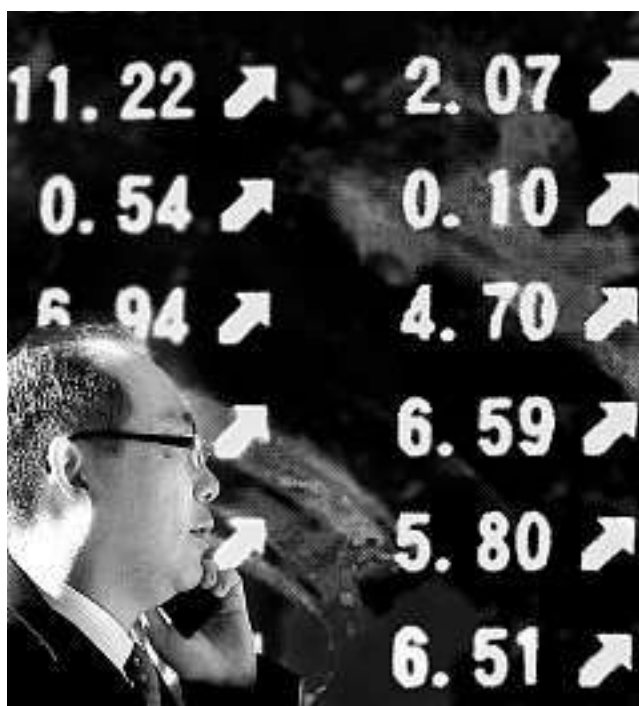
La «febbre delle borse» è uno stato di malattia?

Ma dopo lo scoppio della crisi del 2007-08 sia sulla stampa quotidiana che nelle riviste accademiche sono tornate le metafore mediche – quasi l'intero campionario descritto qui. Le crisi economiche concrete, nella loro violenza e pervasività, di tanto in tanto si prendono la rivincita sul ciclo economico, rifiutandosi di farsi ingabbiare in un'asettica e tranquillizzante oscillazione sinusoidale, e ci ricordano che nel sistema economico c'è pur sempre «qualcosa che non funziona».