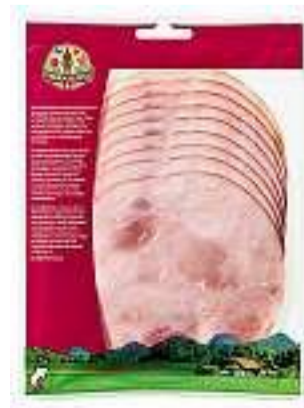
Prosciutto cotto paesano TerraSuisse 164 g Fr. 5.40