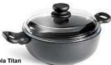
Casseruola Titan antiaderente Ø 24 cm Fr. 69.90*