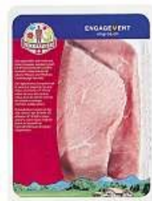
Fettine fesa di vitello TerraSuisse 100 g Fr. 7.10