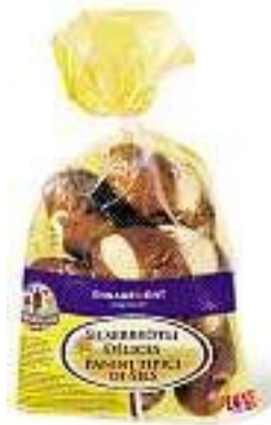
Panini di Sils TerraSuisse 6 pezzi Fr. 3.80