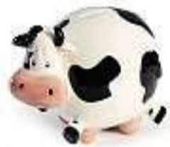
Mucca salvadanaio Fr. 4.50*