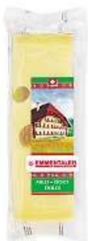
Emmentaler dolce ca. 450 g, 100 g Fr. -.95** anziché Fr. 1.60