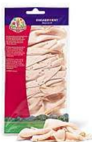
Fleischkäse TerraSuisse affettata finemente 100 g Fr. 2.10