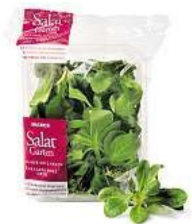
Formentino al prezzo del giorno

Ricetta di Cucina di Stagione Più ricette su www.saison.ch