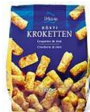
Crocchette di patate rösti surgelate, 600 g Fr. 5.80