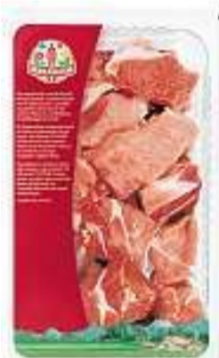
Spezzatino di maiale TerraSuisse 100 g Fr. 2.-