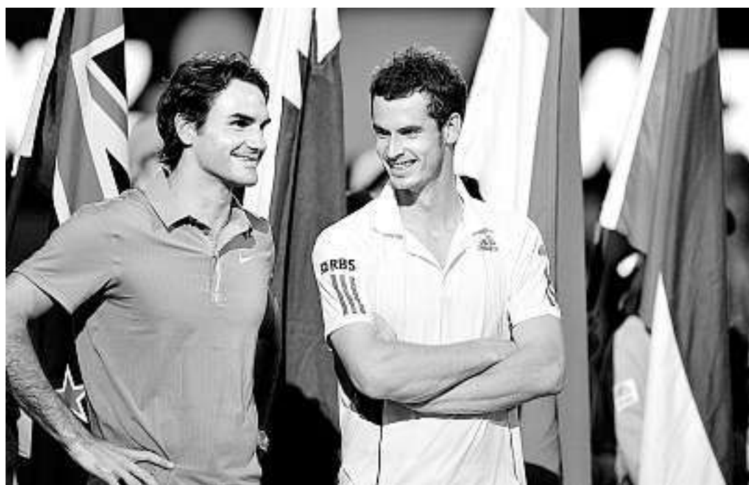
Roger Federer e Andy Murray.

Federer appare inarrivabile. Ha scritto Gianni Clerici, dopo il facile successo in semifinale contro il francese Jo-Wilfried Tsonga (reduce dall'aver eliminato il serbo Novak Djokovic in cinque set), che al «suo svizzero» mancava soltanto l'aureola. Capito?