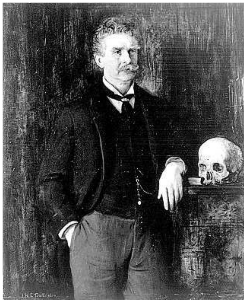
Ambrose Bierce in un ritratto di J.H.E. Partington.

I bravi, naturalmente, non si chiamano fuori. Di sé, Ambrose Bierce diceva «io vendo insulti». Guido Almansi gli