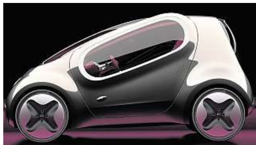
Concept car avveniristica: la Kia Pop.

La piccola Honda sarà la prima auto del suo segmento equipaggiata con un sistema ibrido parallelo di alimentazione. Si tratta del sistema IMA (Integrated Motor Assist), quello già introdotto su Honda Insight e Honda CR-Z e che oggi viene utilizzato da oltre mezzo milione di veicoli. Jazz in determinate condizioni, a basse e medie velocità, potrà marciare utilizzando esclusivamente il propulsore elettrico che è abbinato ad un motore 1.3 i-VTEC e a un cambio automatico CVT. Honda Jazz Hybrid si differenzia esteticamente dalla gamma attuale per i fanali anteriori che ora hanno un contorno blue e quelli posteriori chiari che si abbinano a un nuovo paraurti e una nuova guarnizione cromata posteriore. Per passare meno inosservati si può sempre optare per il nuovo colore Lime Green metallic (un verde molto appariscente) che è stato creato apposta per questo nuovo ecologico modello. Jazz Hybrid sarà introdotta sui primi mercati europei a inizio 2011 ma i prezzi non sono ancora stati comunicati.