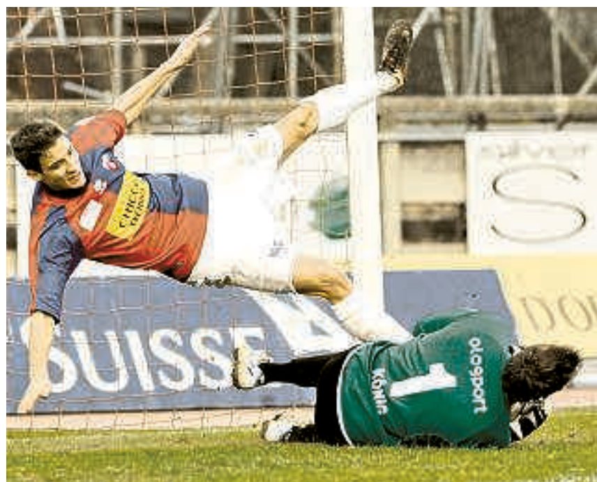
Tra le «casacche» più desiderate ci sono anche quelle dei portieri.