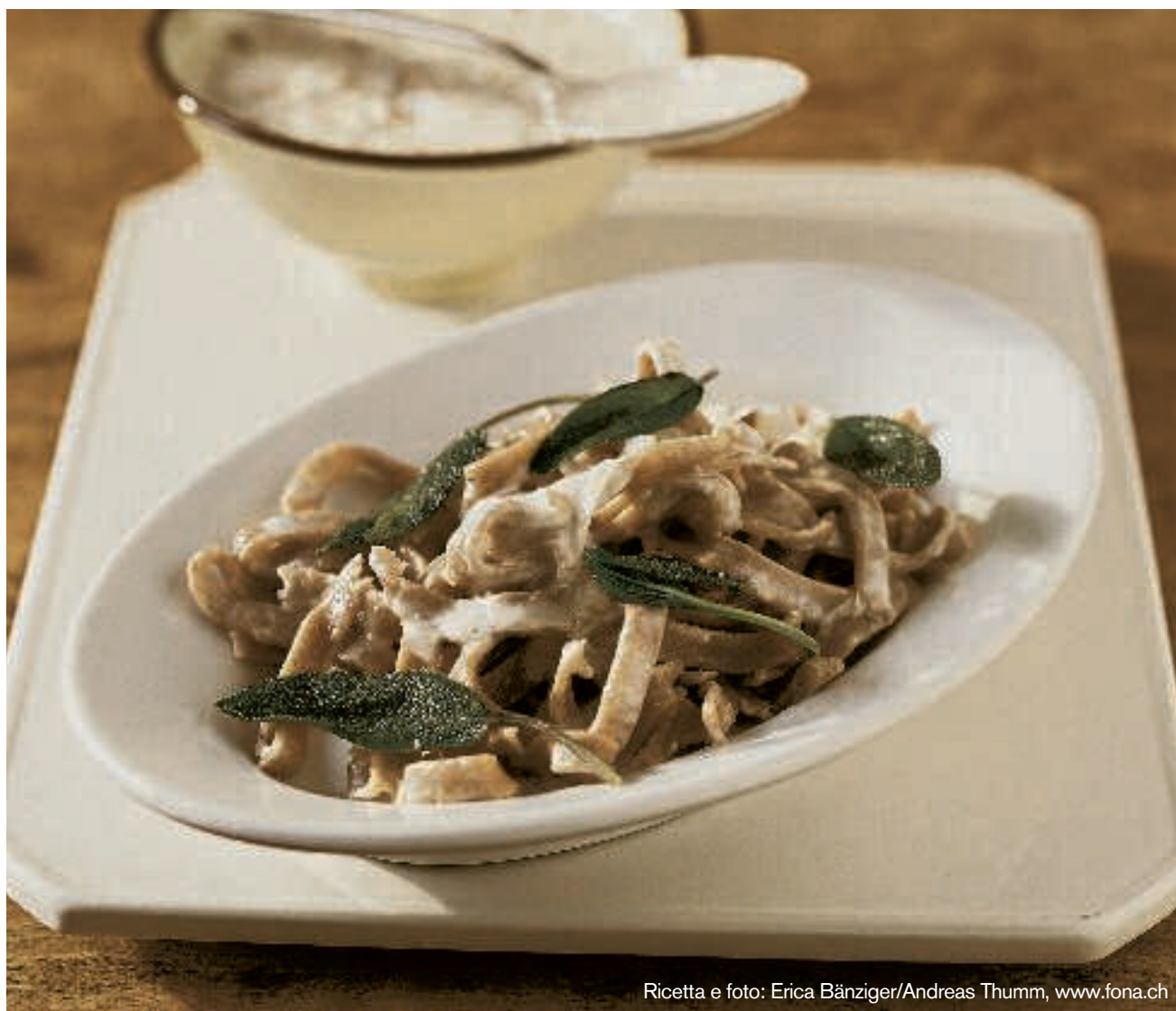
Ricetta e foto: Erica Bänziger/Andreas Thumm, www.fona.ch